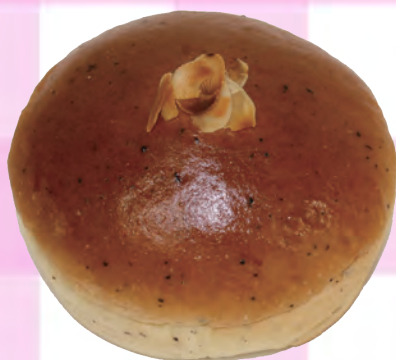
紅茶クリームパン ¥ 200