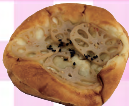
根菜とチキンのフォカッチャ ¥ 220