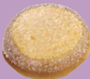
スコレブロー ¥ 180