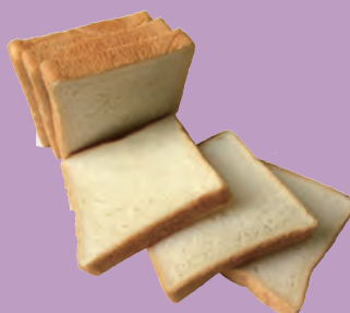
国産小麦のロイヤルブレッド 通常 ¥ 340 → ¥ 300