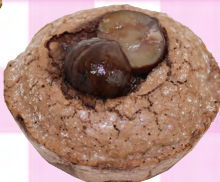
マロン・ショコラ ¥ 250