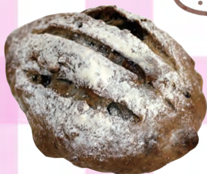
セーグル・オ・フィグノア ¥ 260